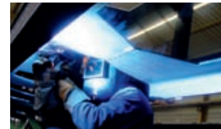
Schweißen im Behälterbau